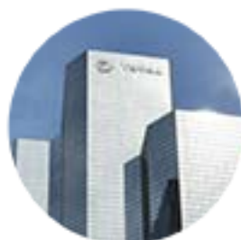
Siège social Paris la Défense www.total.fr

Nos équipes commerciales sur le terrain sont à votre disposition pour aborder ces sujets en détail avec vous et établir l'offre qui vous convient pour mener à bien votre projet.